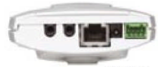
AXIS 210A Network Camera