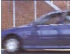
Чересстрочная развертка, разница между нечетными и четными линиями 20 ms