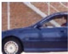
Построчная развертка, в ее линии отображаются одновременно